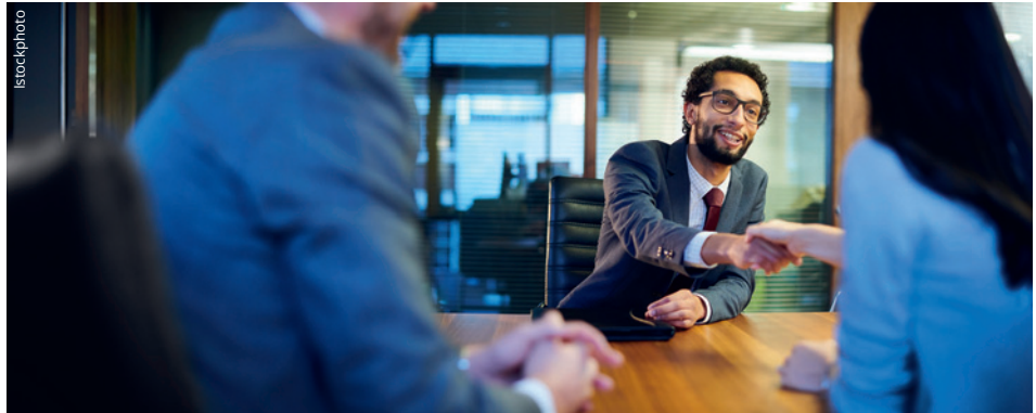
Gute Mitarbeiter sind schwer zu bekommen. Doch Unternehmen, die sich kontinuierlich und systematisch weiterentwickeln, spüren vom Fachkräftemangel wenig.

Bei den meisten Unternehmen liegt die Ursache darin, dass sie schlicht zu wenig attraktiv sind und darum nicht ausreichend Fachkräfte finden – und oft auch nicht ausreichend neue Kunden. Sie haben eine unklare und/